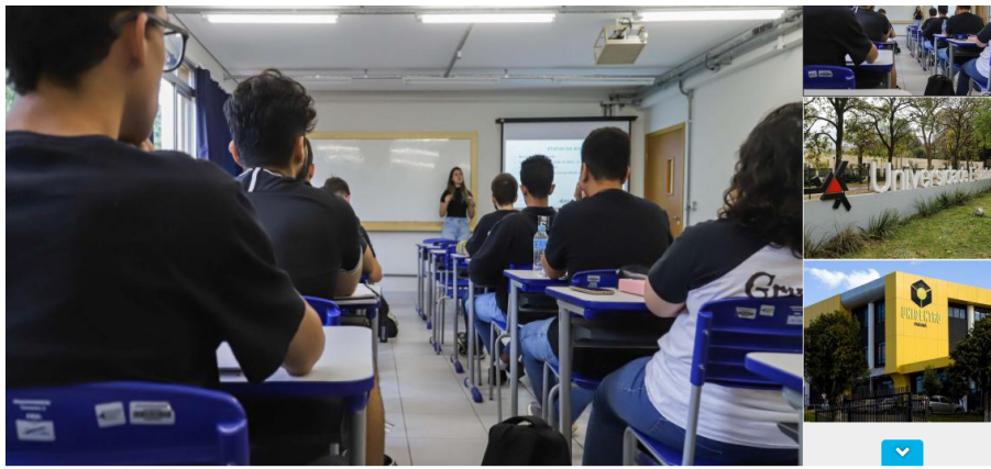
Maringá, 27 de julho de 2023 - Sala de aula da Universidade Estadual de Maringá (UEM).