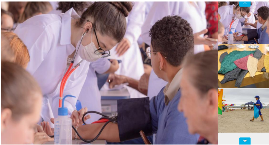
Universidades levam ações culturais e atendimento ao público ao Verão Mais Paraná