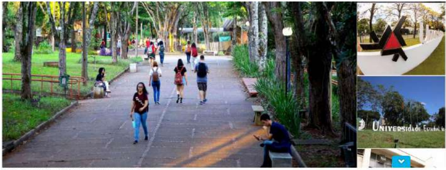
Ensino superior do Paraná está entre os mais bem avaliados do Brasil