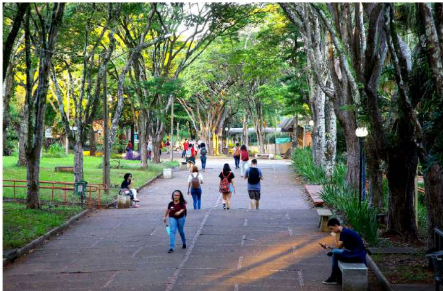
Ensino superior do Paraná está entre os mais bem avaliados do Brasil