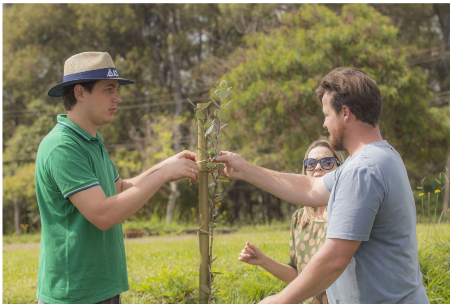
Ranking coloca UEPG entre melhores do Paraná em Objetivos de Desenvolvimento Sustentável