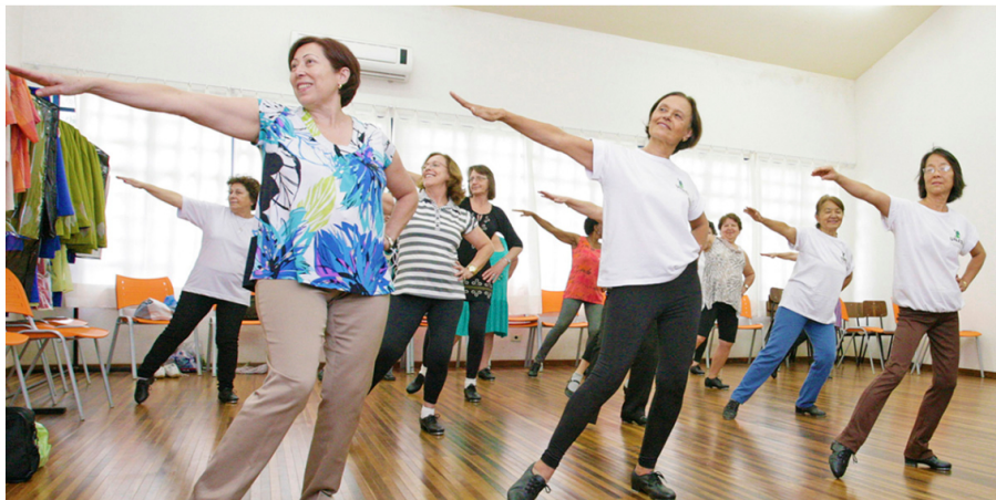
Universidades estaduais reforçam ações para idosos durante o mês de outubro