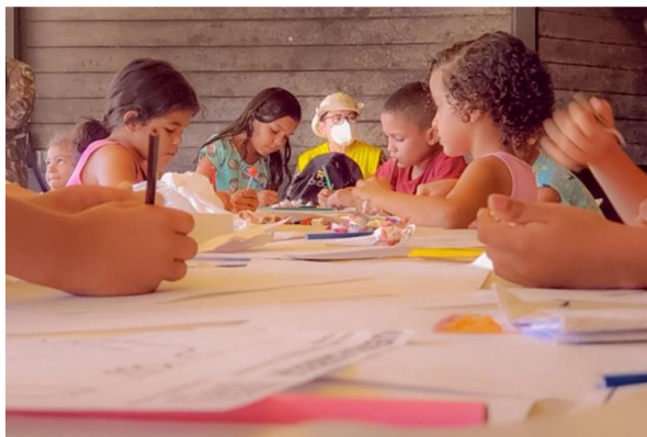
Universidades estaduais fazem ações de cidadania e cultura no Litoral e RMC