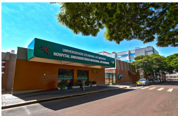
UEM credencia profissionais para plantonistas do Hospital Universitário de Maringá

A Universidade Estadual de Maringá (UEM) está credenciando profissionais de diferentes áreas e especialidades para atuar como plantonistas no Hospital Universitário Regional de Maringá, no Noroeste do Paraná. A iniciativa contempla médicos, assistentes sociais, enfermeiros, farmacêuticos, fisioterapeutas, nutricionistas, técnicos de enfermagem e técnicos de laboratório. Somando R$ 76,1 milhões, a medida envolve recursos próprios da instituição de ensino superior e aporte do Fundo Estadual de Saúde do Paraná (Funsauúde).