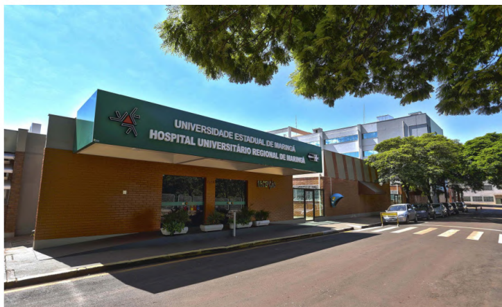
UEM credencia profissionais para plantonistas do Hospital Universitário de Maringá