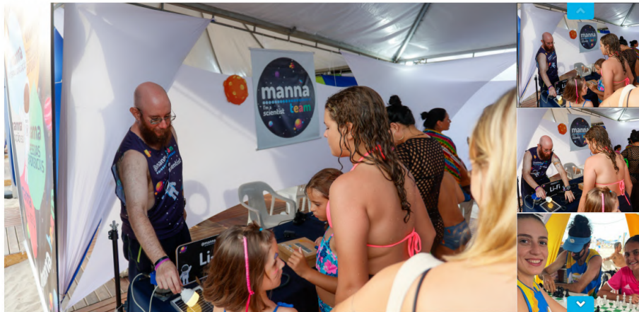
Ciência no verão: universidades estaduais levam tecnologia e diversão aos turistas