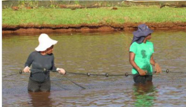
As pesquisas promoveram um avanço nos estudos para o desenvolvimento de material genético que dispense a necessidade de reversão na produção.

Parceria de transferência de tecnologia entre Brasil e Moçambique começou há dois anos, em fevereiro de 2022.