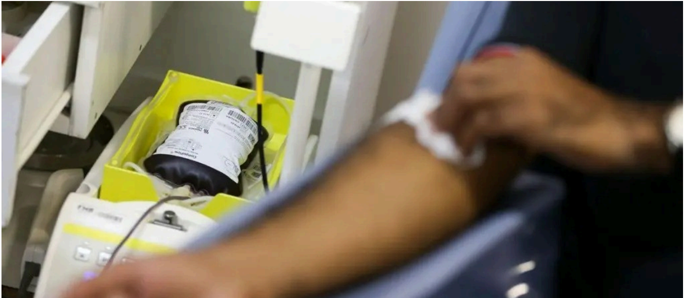
Dia Mundial do Doador de Sangue: o que você precisa saber para doar