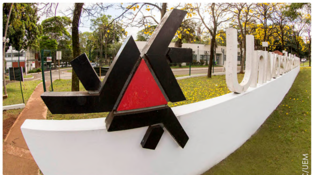
12/07/2024 01:03 em Notícias de Maringá

A Universidade Estadual de Maringá (UEM) está entre as melhores do Brasil ranqueadas no Leiden Ranking 2024 , classificação internacional sobre publicações científicas, que inclui 1.506 universidades de 72 países. Além da UEM, outra Instituição de Ensino Superior (IEES) paranaense classificada foi a Universidade Estadual de Londrina (UEL). As duas são destaques no grupo de 38 instituições de ensino superior brasileiras classificadas.