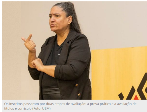
Os inscritos passaram por duas etapas de avaliação: a prova prática e a avaliação de títulos e currículo

As inscrições para o Processo Seletivo Simplificado (PSS), em caráter temporário, para tradutor intérprete da Língua Brasileira de Sinais (Libras) da Universidade Estadual de Maringá (UEM) terminam na próxima quarta-feira (17). O edital prevê duas vagas e salário no valor de R$ 7.616,88 para 40 horas semanais. O contrato pode ter prazo máximo de dois anos, já considerando as prorrogações permitidas em lei.