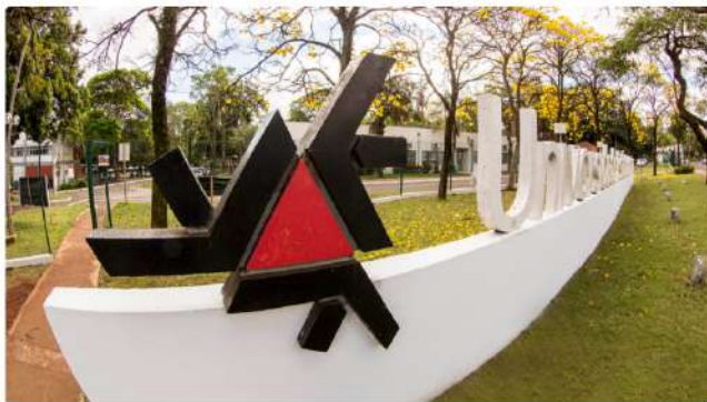
19/07/2024 10:39 em Notícias de Maringá

A Universidade Estadual de Maringá (UEM) celebrou, ao longo desta semana, a aprovação de três novos cursos de doutorado. Entre eles, estão os dois primeiros doutorados profissionais da instituição, nas áreas de Ensino de História e de Políticas Públicas. O outro curso aprovado foi o de Bioenergia, na modalidade acadêmica.