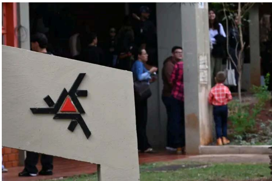
Data final de inscrição é dia 5 de novembro para ambos os concursos