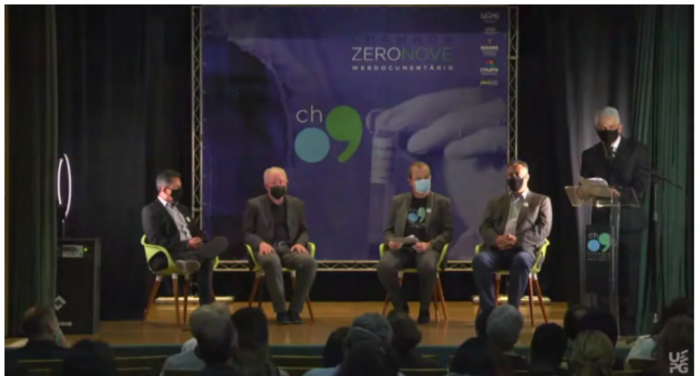
Foto: Autoridades reunidas para o lançamento do documentário, que registrou ações das sete IEES durante 1 ano e meio de pandemia no Paraná.

O Governo do Estado lançou nesta segunda-feira, 22, um web documentário que retrata