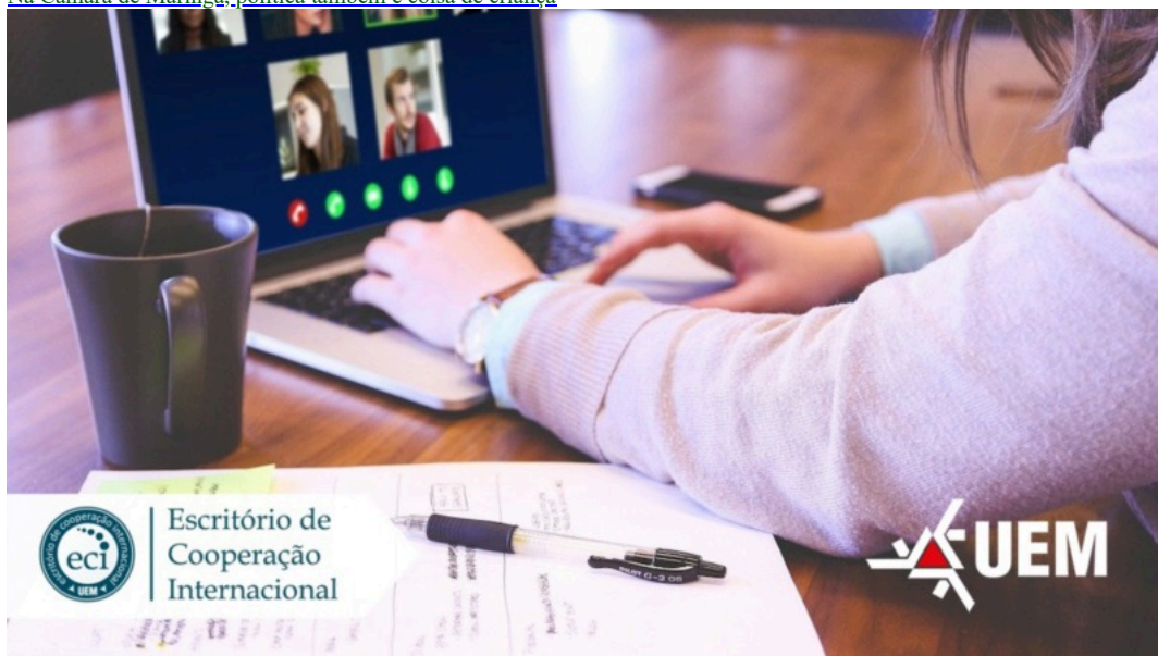
Notícias de Maringá

Na Câmara de Maringá, política também é coisa de criança