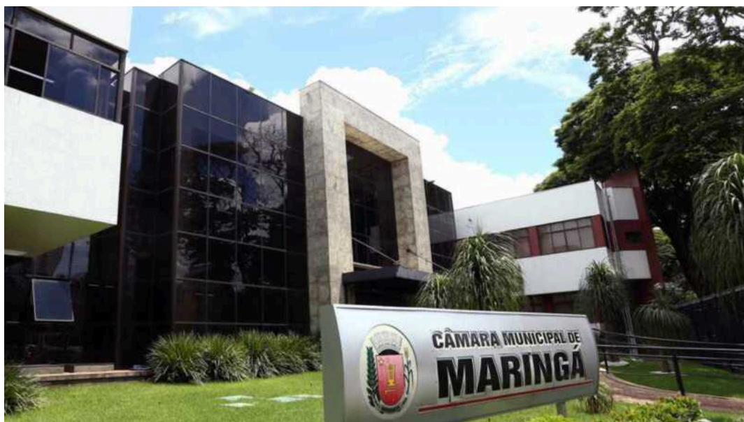
Notícias de Maringá