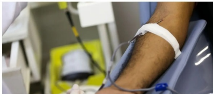
Hemocentro do HUM retoma aos poucos o volume de doações de sangue pré-pandemia | Imagem Ilustrativa | Foto: Marcelo Camargo/Agência Brasil

Compre no Condor Maringá Supermercado Condor Maringá