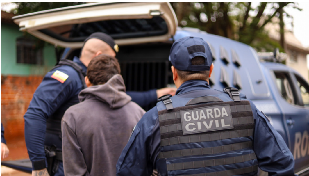
Notícias de Maringá