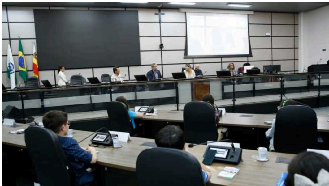
Notícias de Maringá