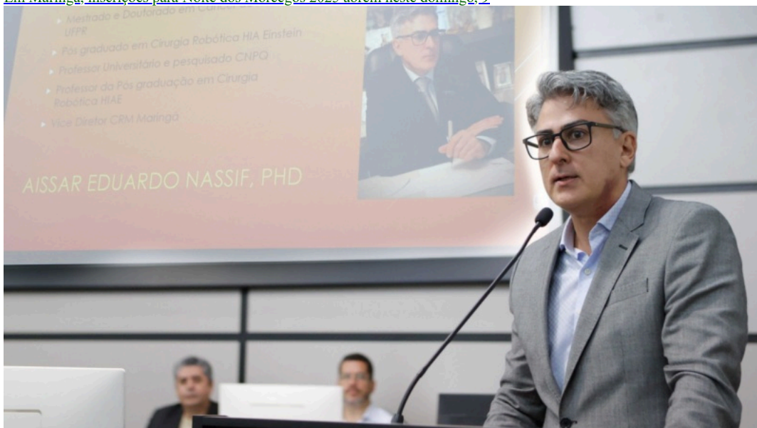
Notícias de Maringá

Em Maringá, inscrições para Noite dos Morcegos 2025 abrem neste domingo, 9