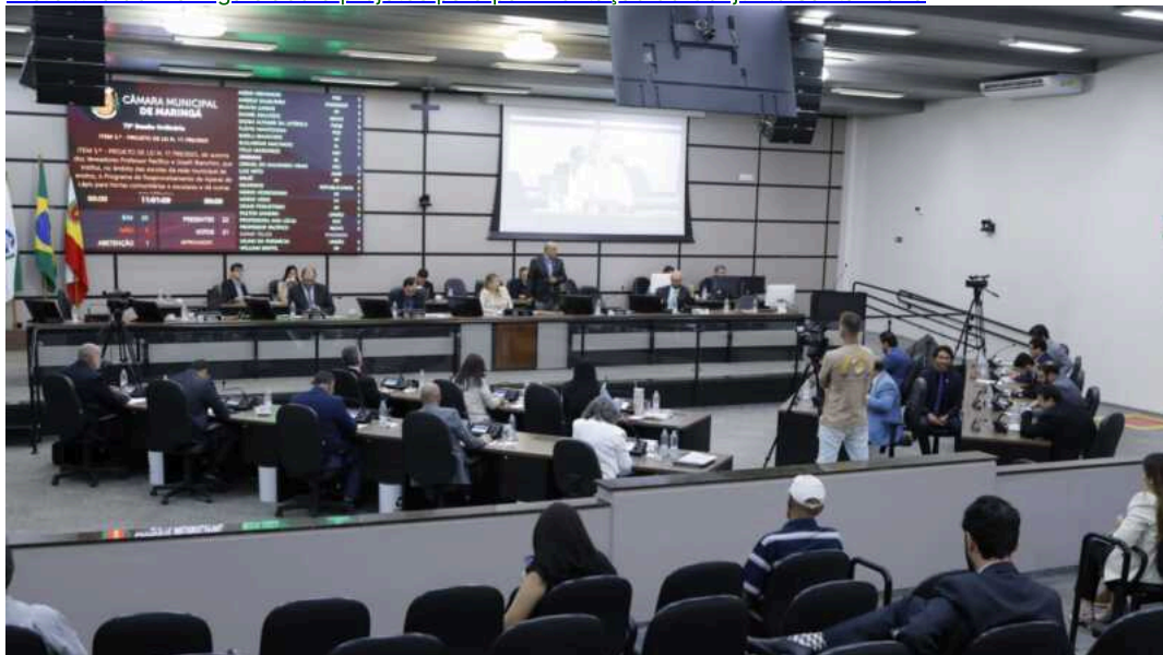
Notícias de Maringá