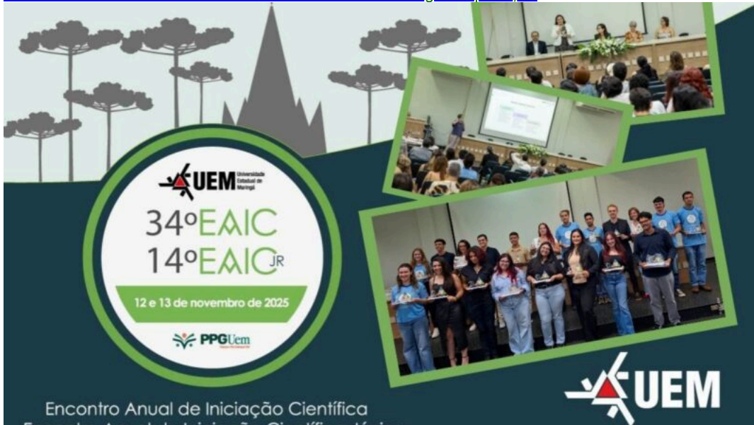
Notícias de Maringá