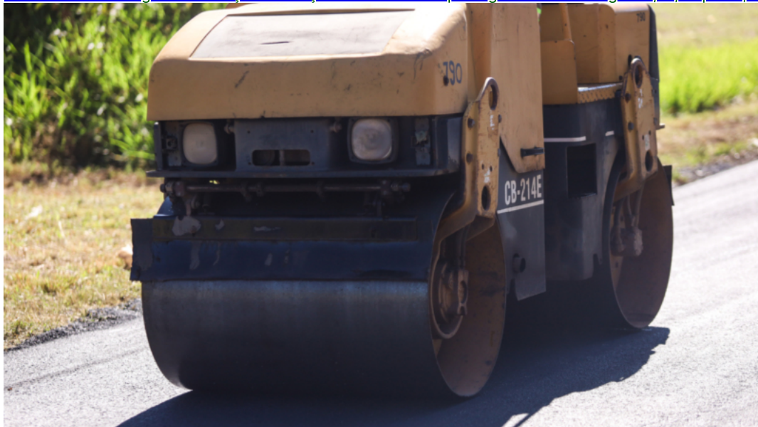
Notícias de Maringá