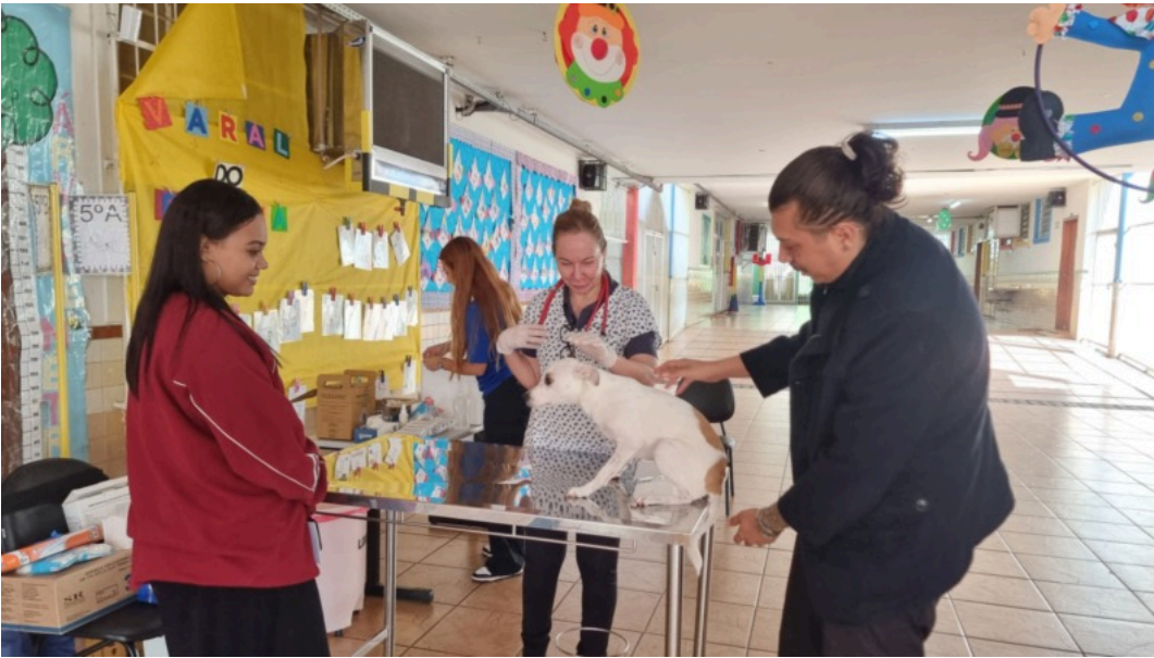
Notícias de Maringá