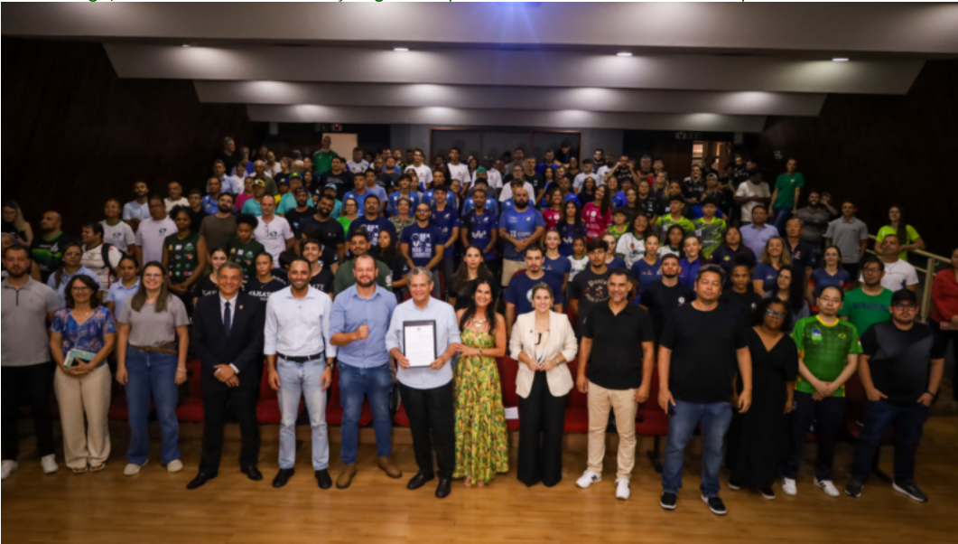
Notícias de Maringá

Em Maringá, Imuniza Pet leva vacinação gratuita para cães de famílias atendidas pelo Cras Mandacaru