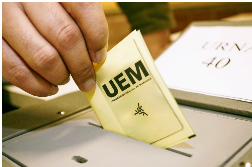
Universidade terá eleição para reitor e vice-reitor

A Comissão Eleitoral encarregada de conduzir o processo para a escolha do novo reitor e vice-reitor da Universidade Estadual de Maringá para a gestão 2022 a 2026 publicou hoje edital com a lista prévia das pessoas aptas a votar no pleito.