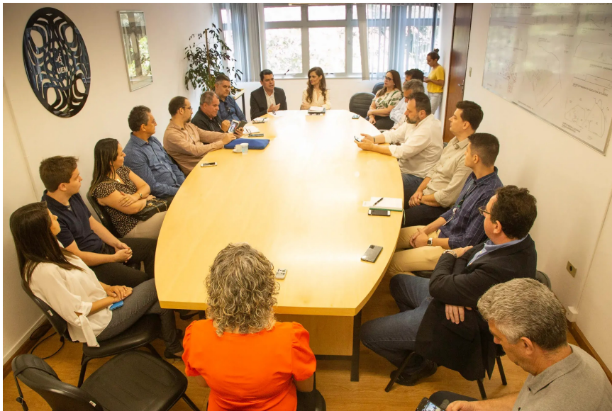
Reunião integra edição local da Inovaweek este ano

Representantes do Centro de Tecnologia, da Universidade Estadual de Maringá, se reuniram hoje com agentes externos promotores de Inovação, como parte da programação da Inovaweek Maringá 2022, evento iniciado também hoje e que prossegue até quarta-feira (19).