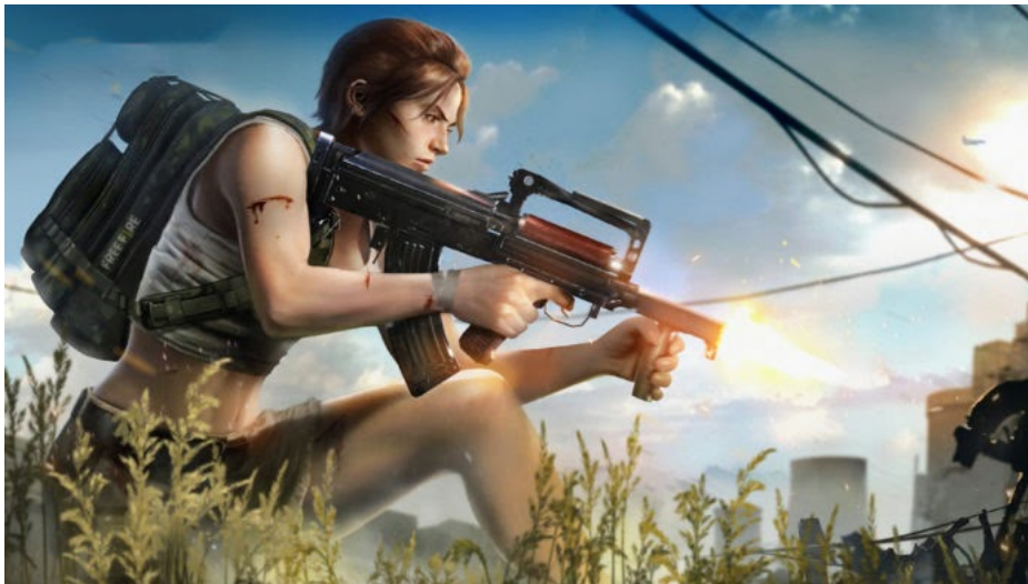
Free Fire é uma das modalidades

Termina amanhã o prazo para que estudantes da Universidade Estadual de Maringá se inscrevam ao processo para selecionar os acadêmicos que irão representar a instituição nos e-Sports (jogos eletrônicos), a serem disputados nos 61º Jogos Universitário do Paraná.