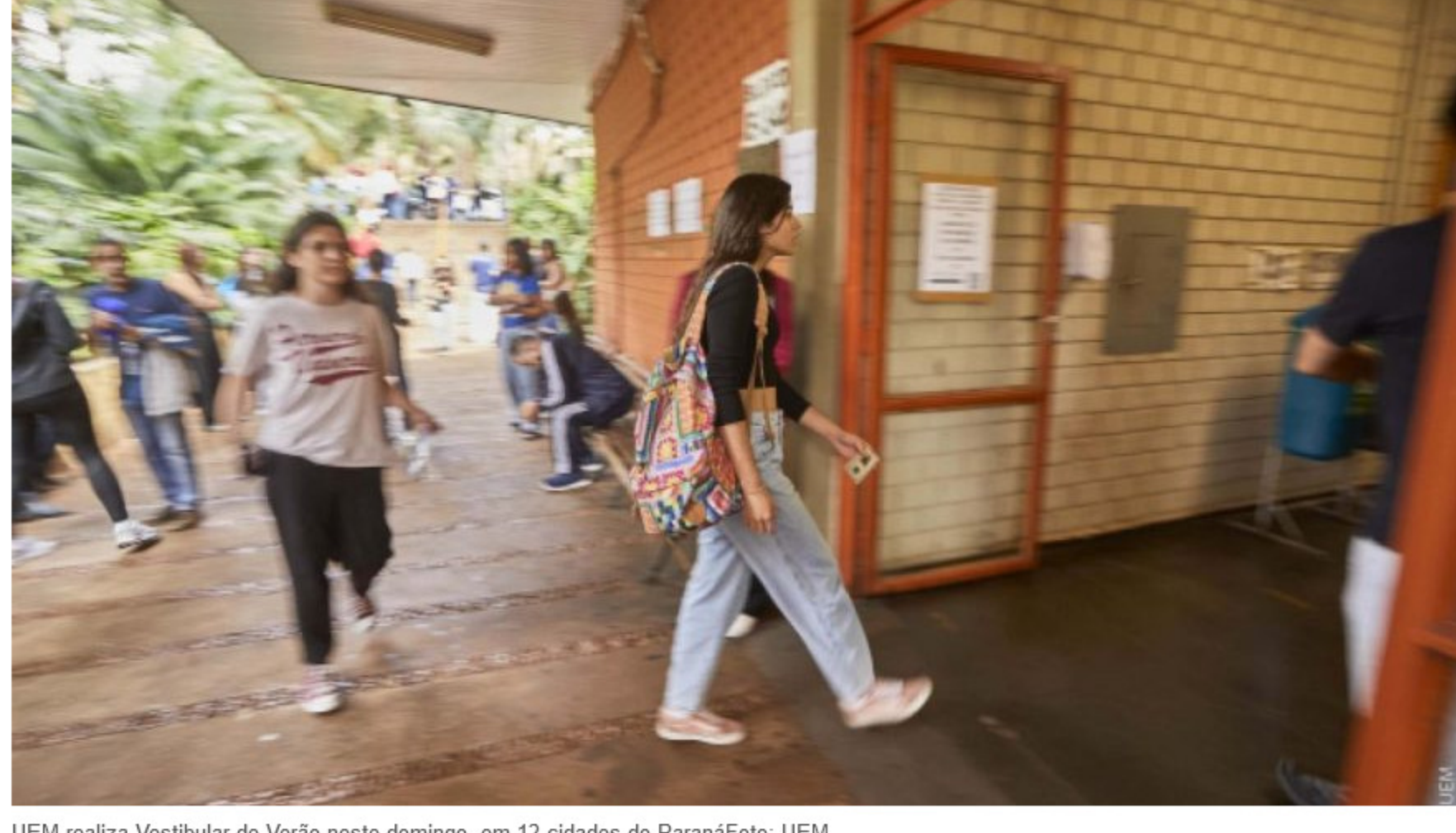
UEM realiza Vestibular de Verão neste domingo, em 12 cidades do Paraná

A Universidade Estadual de Maringá (UEM) promove neste domingo (10) o Vestibular de Verão 2023. As provas ocorrem entre 13h50 e 19h, conforme o horário de Brasília, com aplicações em 12 municípios paranaenses.