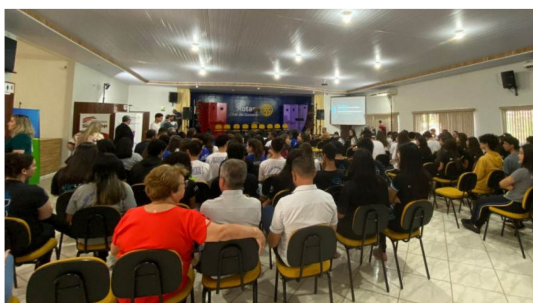
Mais de 300 pessoas participam de semana sobre conscientização fiscal e tributária