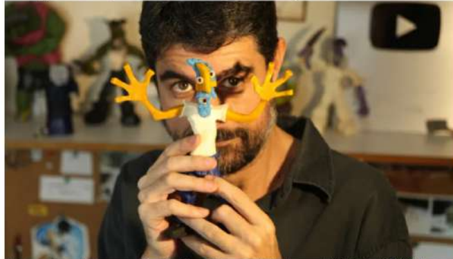
Lúa desenvolveu e construiu bonecos para o longa infantil Teca e Tutú. Como animador, trabalhou na novela "Meu Pedacinho de Chão (2014)", na série "Hoje é Dia de Maria (2005)" e na série de reportagens do Fantástico "Quem eu sou? (2017)".

Cineasta já ganhou diversos prêmios como Anima Mundi (2003) e Vladimir Herzog (2017).