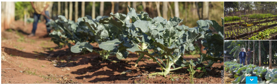
Projeto de extensão da UEM promove cultivo de alimentos para pessoas em recuperação