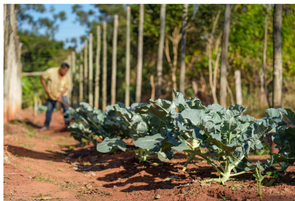
Projeto de extensão da UEM promove cultivo de alimentos para pessoas em recuperação

Responsabilidade social, sustentabilidade e segurança alimentar caminham lado a lado em um projeto de extensão da Universidade Estadual de Maringá (UEM). Vinculada ao Departamento de Agronomia da instituição estadual de ensino superior, a iniciativa mantém hortas comunitárias em casas de recuperação que atendem pessoas em situação de rua ou em tratamento da dependência de substâncias químicas no distrito de Iguatemi, na zona rural de Maringá, região Noroeste do Paraná.