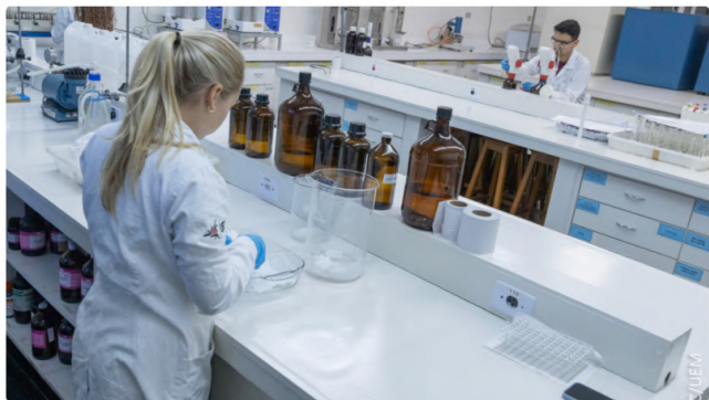
27/06/2024 12:06 em Notícias do Paraná

O Governo do Estado liberou na terça-feira (25) mais um aporte financeiro para apoiar iniciativas das universidades estaduais do Paraná, no âmbito dos cursos de graduação. A chamada pública, no valor de R$ 5 milhões, é destinada para atender demandas relativas à melhoria das condições acadêmicas em diferentes áreas do conhecimento, desde infraestrutura até novas metodologias de ensino e qualificação de professores e estudantes. As propostas podem ser enviadas até 30 de julho e o prazo para execução dos projetos pedagógicos segue até dezembro deste ano.