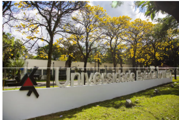
UEM prorrogou prazo de inscrições para Vestibular e PAS

O prazo para as inscrições do Vestibular e do Processo de Avaliação Seriada (PAS) 2021 da Universidade Estadual de Maringá (UEM), no norte do Paraná, termina nesta segunda-feira (8).