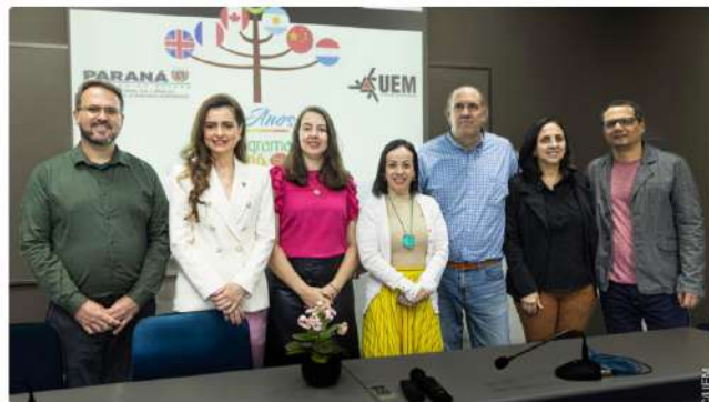
24/07/2024 10:28 em Notícias de Maringá

A Universidade Estadual de Maringá (UEM) comemorou, na segunda-feira (22), uma década de implantação do Programa Paraná Fala Idiomas (PFI), vinculado à Secretaria de Ciência, Tecnologia e Ensino Superior (Seti). Criado em 2014, o programa oferta cursos de idiomas gratuitos às comunidades acadêmicas das sete universidades estaduais do Paraná.