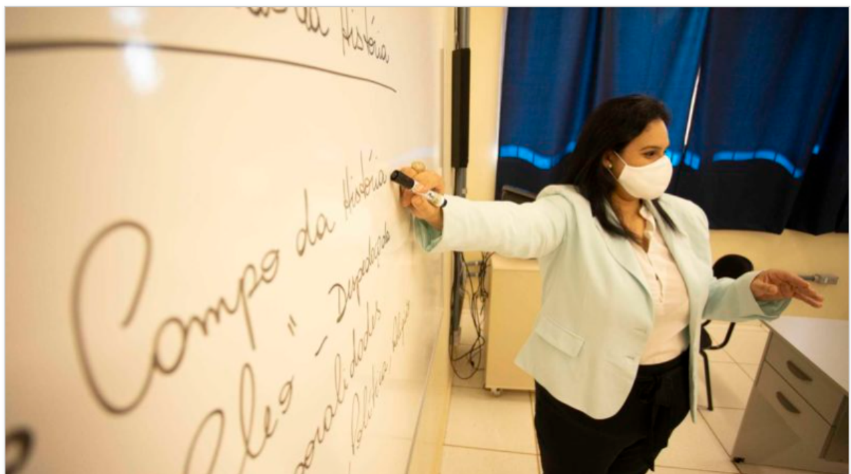
Aulas presenciais das graduações retornam a partir de 17 de janeiro