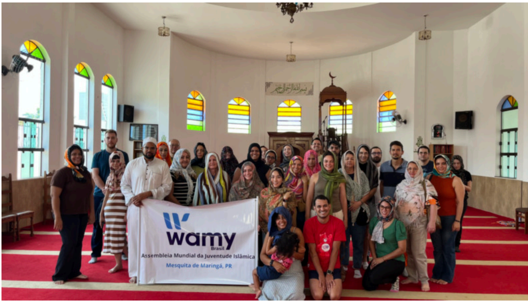
Notícias de Maringá