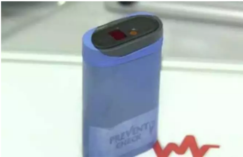
Teste desenvolvido por pesquisadores de Maringá detectam presença do novo coronavírus em