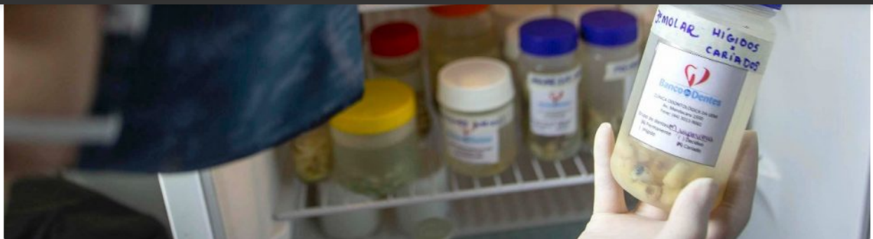
Banco de Dente Humano.