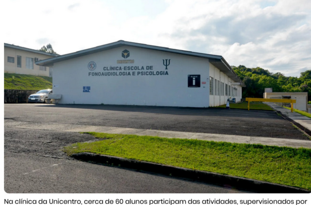
Na clínica da Unicentro, cerca de 60 alunos participam das atividades, supervisionados por sete professores | Foto: Divulgação - Seti-AEN

Aproximadamente 60 alunos participaram das atividades, supervisionados por sete professores. Os agendamentos podem ser feitos por telefone – seguem até março e retornam em maio, após o recesso, para acompanhar o calendário letivo da universidade.