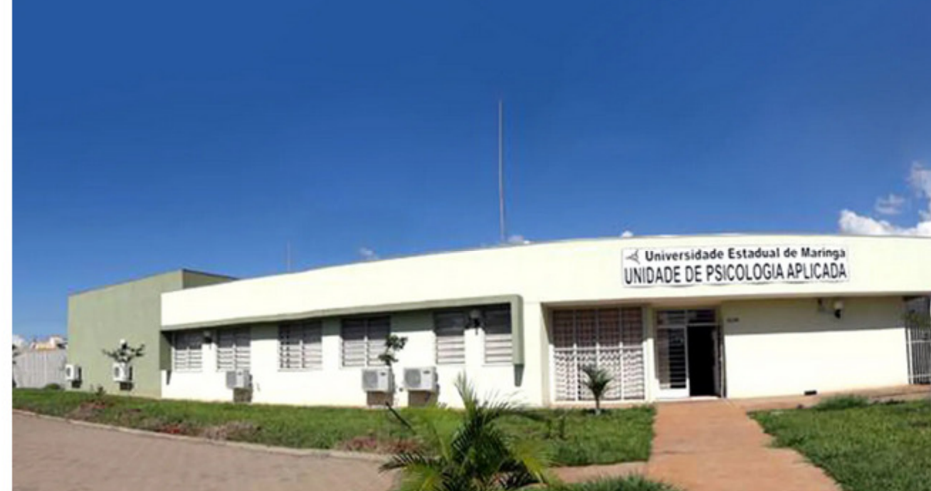
A UPA da UEM funciona desde a década de 1980

O serviço acompanha o calendário letivo da UEM. Vai até 26 de março, com data prevista para retorno das atividades na segunda semana de maio deste ano. Os interessados devem entrar em contato via whatsapp.